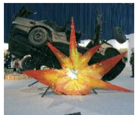
Kunst liefert explosiven Stoff für Diskussionen!

zum Thema „Badische Revolution“, Stadtführung „Jugendstil“ oder „Dammerstocksiedlung“