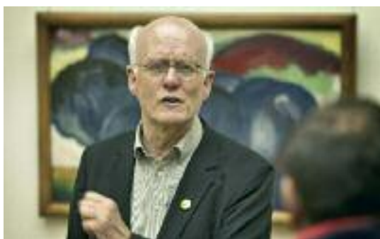
Wir sprechen mit Ihnen über Bilder und Kunst