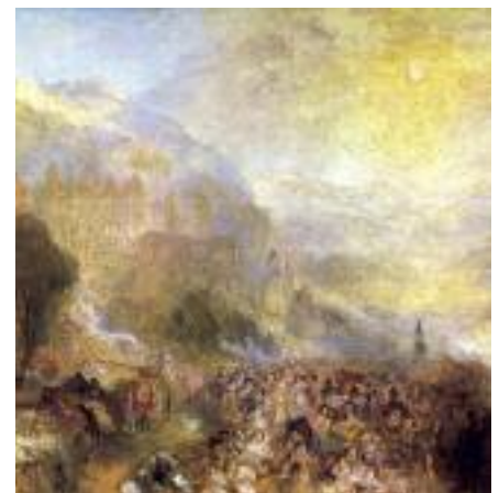
Joseph Maillord William Turner: Heidelberg 1844 – 1845

Fr. 11.05. – So. 13.05.2012 (Schwerpunkt: Turner-Monet-Twombly) Fr. 24.08. – So. 26.08.2012 (Schwerpunkt: Musikfest „Glaube“) Fr. 09.11. – So. 11.11.2012 (Schwerpunkt: Künstlerateliers)