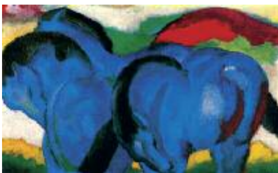
Franz Marc: Die kleinen blauen Pferde, 1911