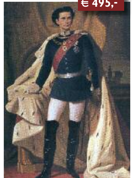
Piloty d.J.: König Ludwig II. mit Krönungsmantel