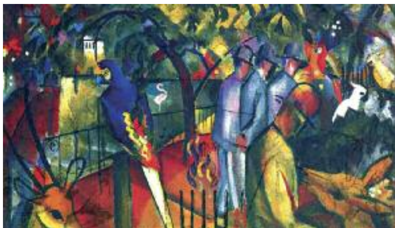
August Macke: Zoologischer Garten, 1912 (Städtische Galerie im Lenbachhaus München)