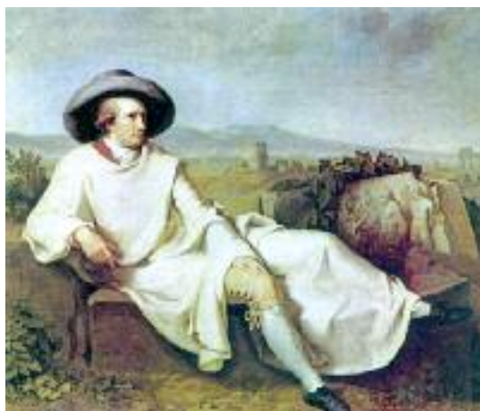
Johann Heinrich Wilhelm Tischbein: Goethe in der römischen Campagna (Städel Frankfurt–Main)

Wir wollen Sie mit außergewöhnlichen Angeboten, erstklassigem Service und speziellen Themenreisen begeistern. Kunstreisen heißt: Abstecher in bedeutende Metropolen und Landstriche unternehmen, Ausstellungen von Weltrang besuchen, exklusive Kunst- und Kulturevents erleben. Doch überzeugen Sie sich selbst: einen Reisespezialisten in Ihrer Nähe finden Sie mit Hilfe Ihrer Postleitzahl auf unserer Website.