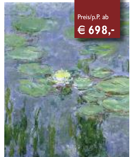
Claude Monet: Seerosenteich (Musée Marmottan, Paris)