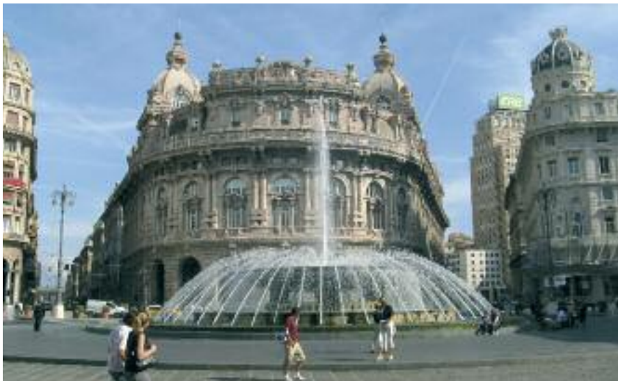
Piazza de Ferrari in Genua

der Altstadt wurden 2006 zum UNESCO-Weltkulturerbe erklärt. Die Gemäldegalerien in den Palästen „Rosso“ und „Bianco“ zeugen mit bedeutenden Werken von Rubens und Van Dyck und vielen anderen Künstlern vom Reichtum der Stadt. Abends laden uns die Restaurants in der Altstadt zum Schlemmen ein. Genua ist schließlich die Heimat des berühmtesten Gerichts Liguriens: Pesto alla Genovese. Unser willkommener Anlass, Genua zu besuchen, ist die Konzertreise des Johann-Sebastian-Bach-Ensembles unter der Leitung von Helmuth Rilling mit Bachs h-Moll-Messe. Und wollten Sie schon immer mal die wunderbare Landschaft der Cinque Terre sehen? Dann sollten Sie unbedingt mitreisen. Denn einen Tag lang entdecken Sie die schönste Landschaft Liguriens, der zum Weltkulturerbe erklärten Cinque Terre: Fünf in Felsnischen eingestützte Dörfer, dazwischen 7.000 km Trockenmauern an steil ins Meer fallenden Wein-, Oliven- und Ginsterhängen. Glücklicherweise sind die Orte der Cinque Terre nur mit dem Zug oder zu Fuß zu erreichen. Wer will, kann nach der Zugfahrt an einer kleineren Wanderung teilnehmen.