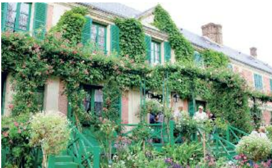
Das Haus im normannischen Stil, in dem Claude Monet mit seiner großen Familie lebte

Nachlass, in der Orangerie seine großformatigen Seerosenpanoramen und im Musée d'Orsay, dem einstigen Prachtbahnhof, einen Überblick über sein Gesamtwerk. Dort werden Sie sich zudem mit den Impressionisten allgemein befassen sowie mit Beispielen jener Salonmalerei, gegen die die jungen Impressionisten rebellierten. Im Musée Rodin sehen Sie an den Werken Rodins und seiner zeitweiligen Mitarbeiterin und Geliebten Camille Claudel, was Impressionismus in der Bildhauerei bedeutet. Bei einem Spaziergang am Montmartre entdecken Sie legendäre Orte, an denen Renoir, Picasso, van Gogh und andere namhafte Künstler lebten und arbeiteten. Höhepunkt der Reise ist der Ausflug in die Normandie: der Besuch des Gartens von Giverny, der im Sommer in intensiven Farben blüht, eine Bootsfahrt in der Auenlandschaft der Seine und der Abend mit Dinner und klassischem Konzert in einem traumhaften Kulturzentrum mit historischer Mühle, Park und Orangerie an der Seine.